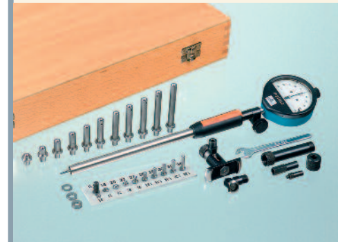
SUBITO® Vario SV