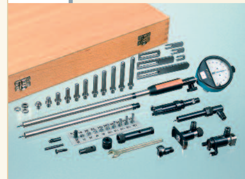
SUBITO® Vario System SVS